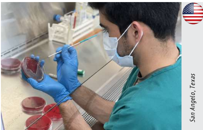
San Angelo, Texas

Bimeda tilbyder også en række diagnostiske tests og analyser gennem diagnostiske laboratorier i USA.