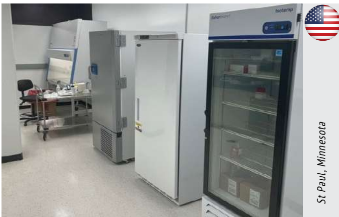
St. Paul, Minnesota