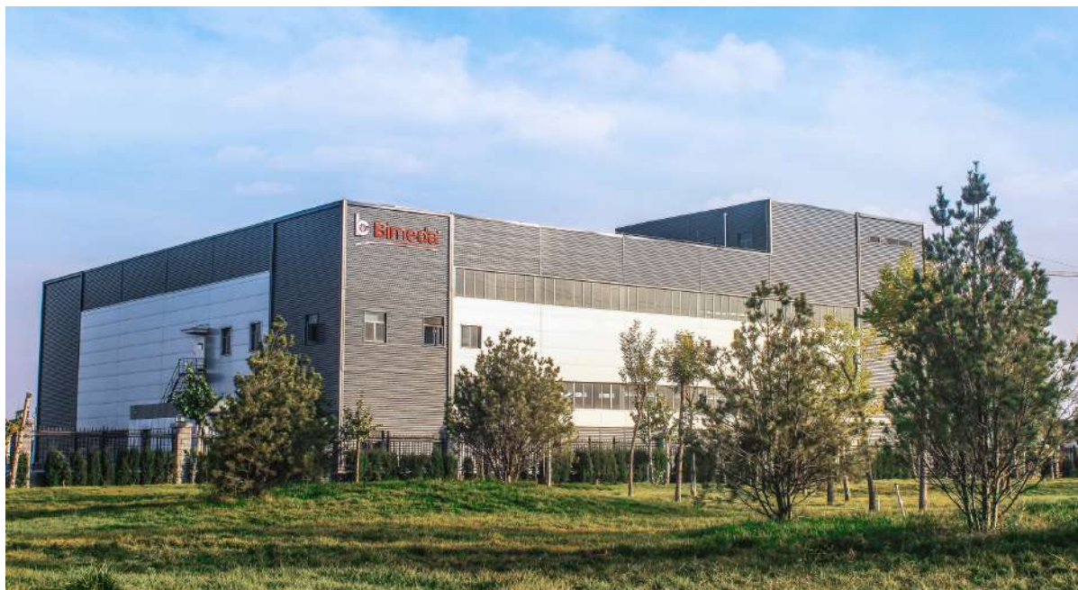
Bimedaanlæg i Shijiazhuang, Hebei, Kina